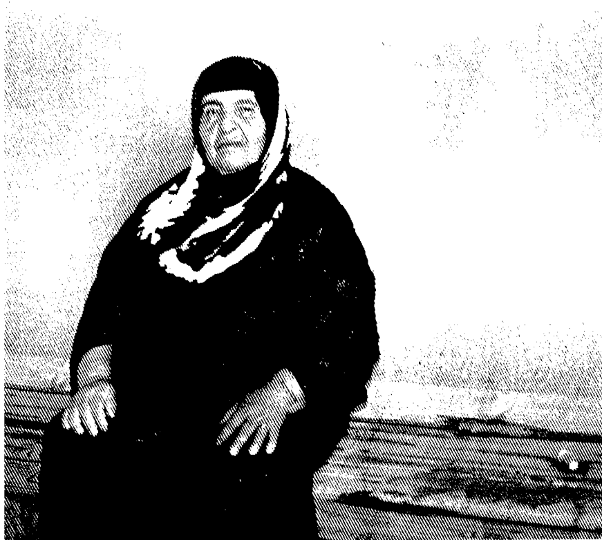
نیرگز عزیز بابا