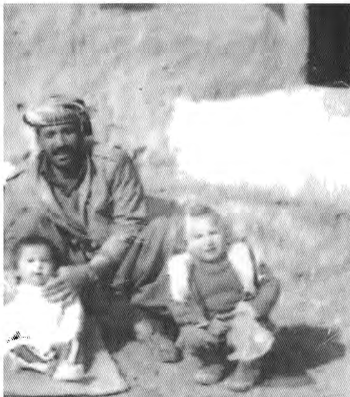
□ عهلی عزیز بابا و مندا له کانی: هه لکهوت و سه رکهوت