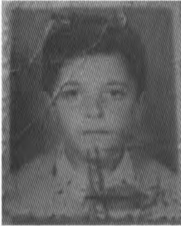
نارام محمد مہد نڈ محمد