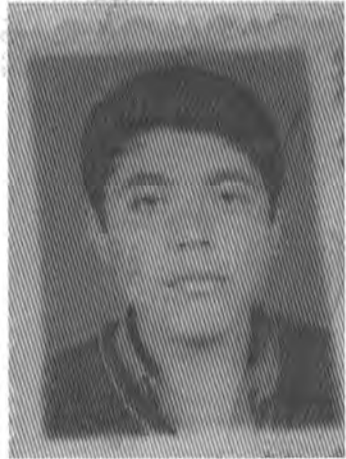
عہ بدول رحمان محمد مہد نڈ محمد