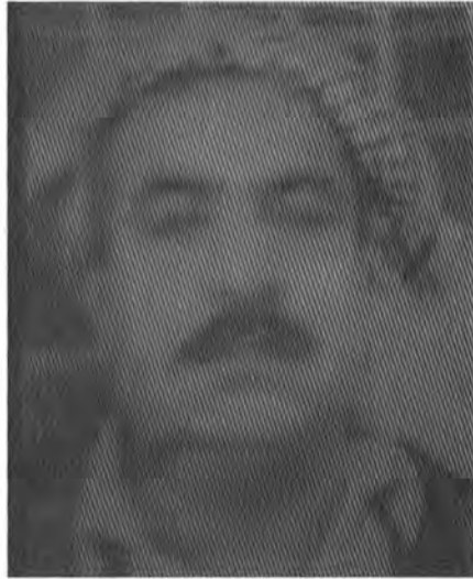
سأح عزیز بابا